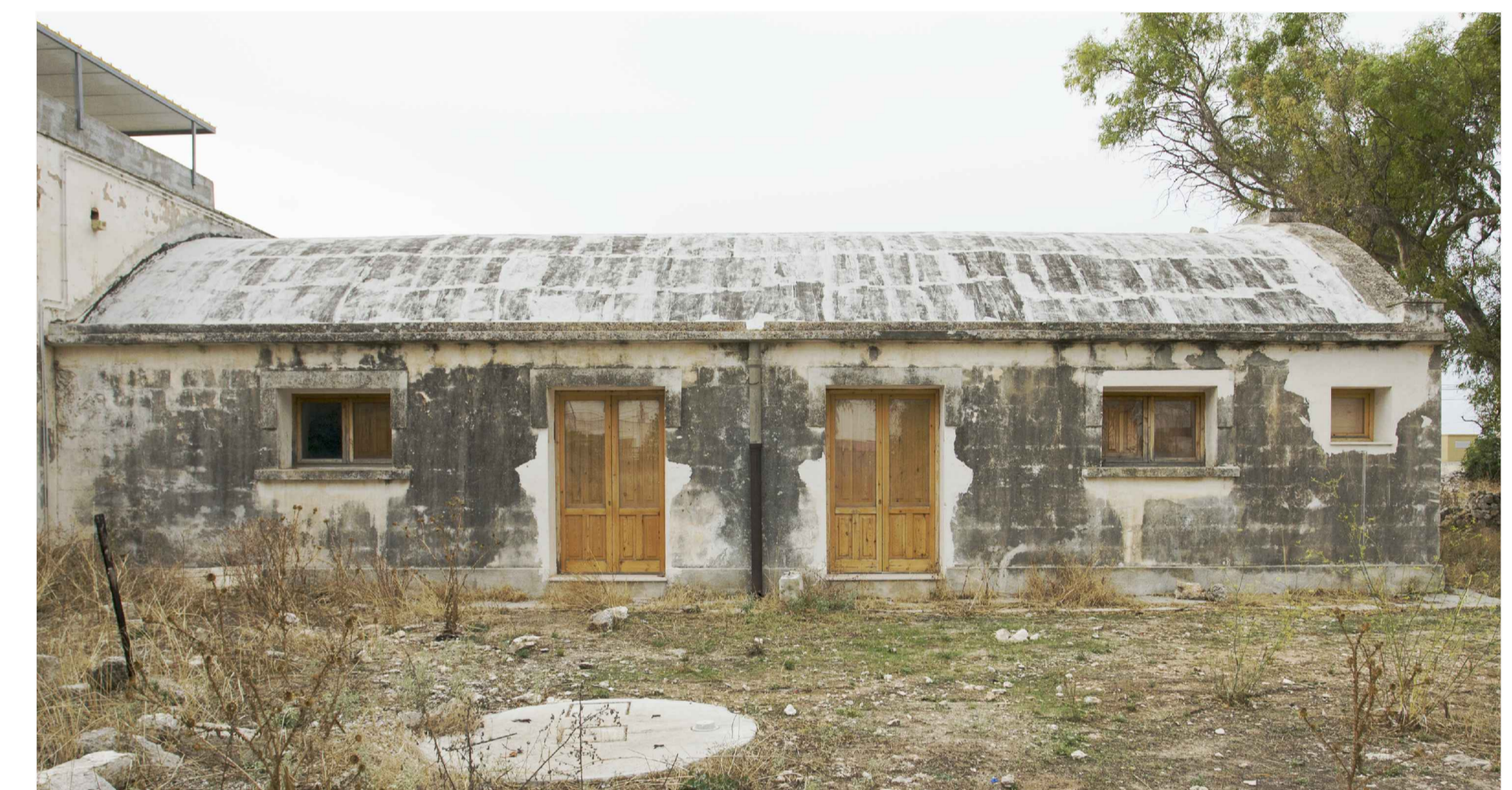
PROSPETTO SUD rilievo fotografico